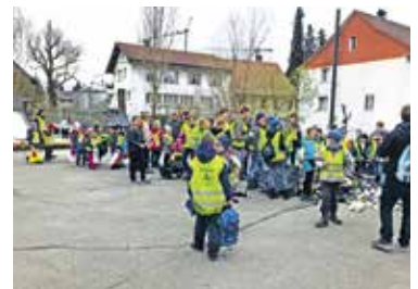
Fötzeli-Aktion mit Primarschule