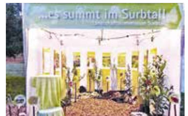
Insektenfreundliche Gärten an der Expo