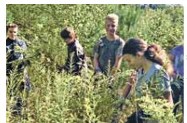
Neophytenbekämpfung mit Schulklassen