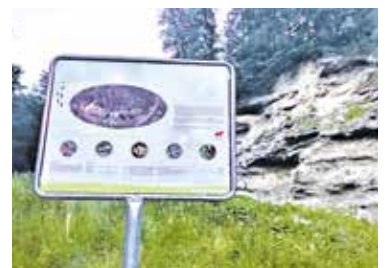
Naturgebiet Hüsliberg, Lengnau