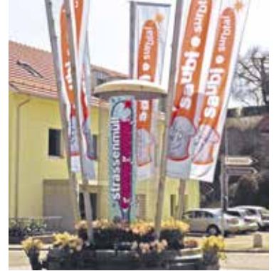
Littering-Aktion auf Kreisel