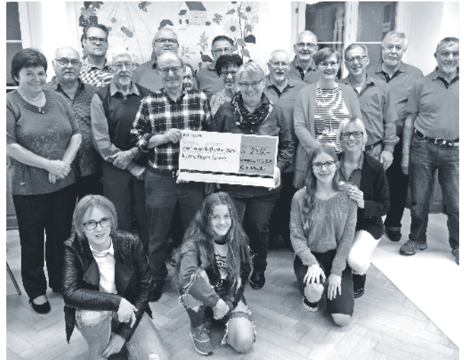
Die «IG Feldküche» und ihre grossen und kleinen Helfer überreichen der Vertretung von Insieme Region Zurzach den Check.

Möglich ist die Spende jedoch erst durch die Freiwilligenarbeit der Mitglieder der IG Feldküche sowie der Mithelfenden. Das verdient höchsten Respekt. Sie hatten guten Grund, im Schulhüsli Vogelsang zufrieden auf ihre uneigennützig Arbeit anzustossen.