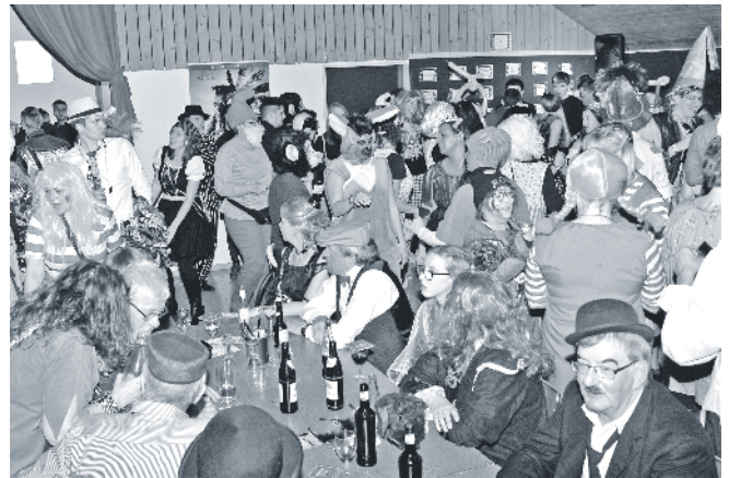
Volles Haus beim «Film ab!» in Unterendingen: Die Fasnächtler feiern eine Nacht lang durch und geniessen die ausgelassene Atmosphäre.

Die 15 Traktanden waren bereits um 21.15 Uhr abgearbeitet und dann konnten Kaffee und Dessert in Angriff genommen werden. Danach blieb noch genügend Zeit für interessante Gespräche, welche für einen schönen Ausklang dieses gelungenen Abends sorgten.