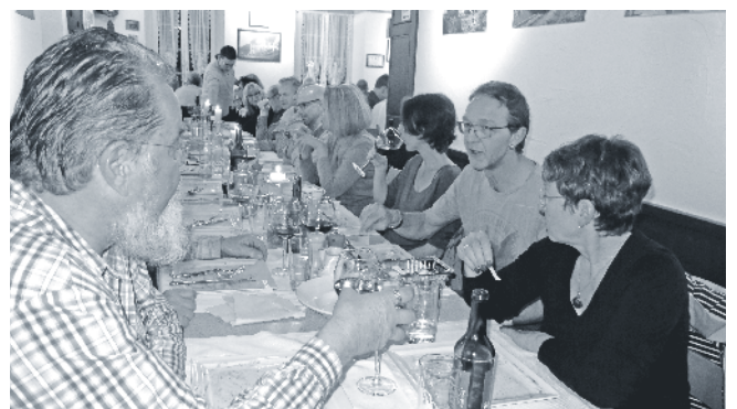
Blick auf die Mitgliederrunde.